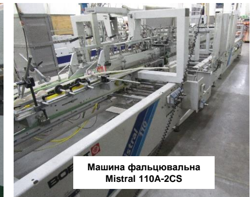
Машина фальцювальна Mistral 110A-2CS