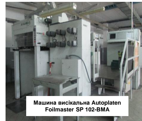
Машина вісікальна Autoplaten Foilmaster SP 102-BMA