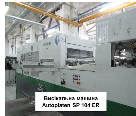
Вісікальна машина Autoplaten SP 104 ER