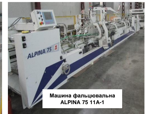
Машина фальцювальна ALPINA 75 11A-1