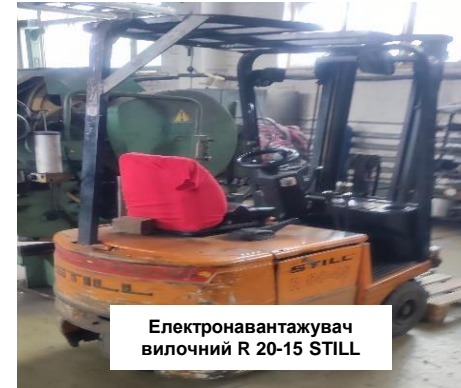
Електронавантажувач вилочний R 20-15 STILL