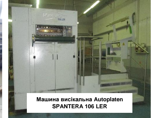
Машина вісікальна Autoplaten SPANTERA 106 LER